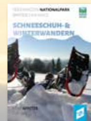
Pocketguide SCHNEESCHUH- & WINTERWANDERN