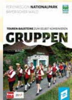
Pocketguide TOUREN-BAusteINE FÜR GRUPPEN