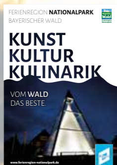
Pocketguide KUNST KULTUR KULINARIK